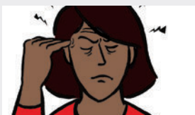
TÈT FE MAL