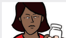
CHANJMAN NAN VIZYON'W